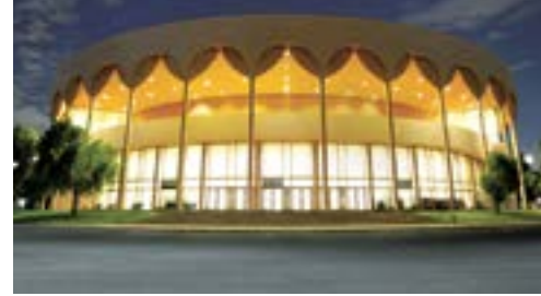
MÁS INFORMACIÓN: www.asugammage.com