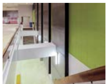
El renovado TCC se distingue por sus líneas modernas y espaciaosas.

El Centro de Convenciones de Tucson inicia una nueva etapa, enmarcada por una merecida y espectacular renovación de sus instalaciones; descúbrelo.