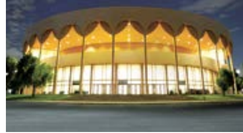
MÁS INFORMACIÓN: www.asugammage.com

Diseñado por el arquitecto Frank Lloyd Wright, el ASU Gammage cumple 50 años de ser un ícono del arte y el entretenimiento en el Estado de Arizona, donde incluso se han llevado a cabo debates presidenciales. Gracias a las gestiones de Grady Gammage, presidente de Arizona State University (1933-1959), se construyó el edificio de carácter público, inaugurado el 18 de septiembre de 1964.